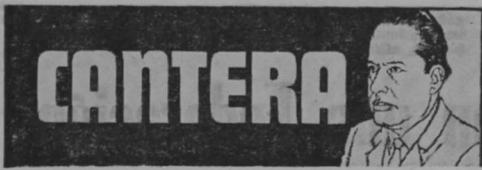
POLITICA Y JUVENTUD

Fernando Valverde Vega Ministro de Seguridad Pública