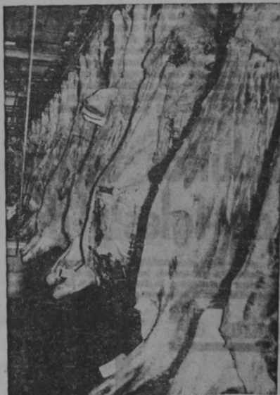
Carne de magnífica calidad para los hogares costarricenses

POSTA POPULAR Alipego Quititeña Falda de Pecho Otras clases