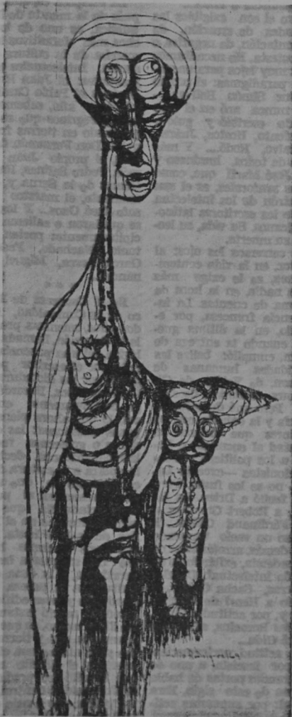
Dibujo de Julio Rodríguez (Guatemala)

fin de semana, porque si no, es el otro de la esquina del frente, que también visitan porque no tienen otro lugar adonde ir.